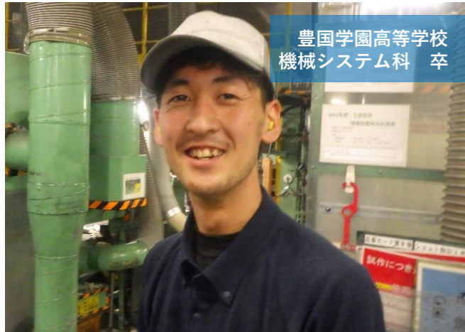
豊国学園高等学校 機械システム科 卒