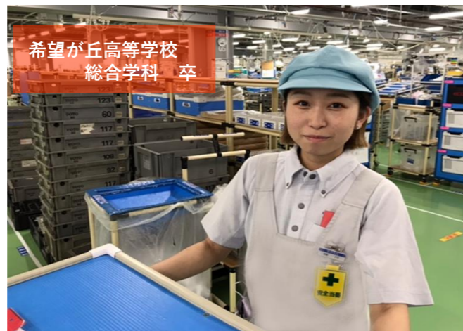
希望が丘高等学校 総合学科 卒

① 鋳造工程で、製品の通水部にあたる中子造型を担当しています。② 作業スピードが上がったと実感した時や、自分が生産した製品の品質があがった時です。③ 現在の担当業務をマスターして、次の工程に向けてスキルアップすることです。④ 現場の雰囲気が明るいため、年齢を気にせずに会話ができて、すぐに職場に馴染めたことです。⑤ 何事も恐れず、全力で立ち向かってください！