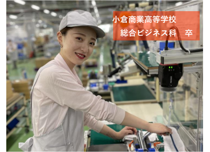
小倉商業高等学校 総合ビジネス科 卒

① 製品の組み立て・検査・包装を担当しており、新商品の立ち上げや間接業務も行っています。② 報告会等で自分の仕事が評価された時です。また、自ら業務の中で問題点を見つけて対策ができた時には成長を感じます。③ 人のためになれるように、製品や間接業務の知識を身につけ、周りを見て行動できる上司を目指しています。④ 周りの人に恵まれていることです。困りごとがあればたくさんの方が助けてくれます。⑤ 失敗を恐れず、何事にも意欲的に取り組んでみてください。必ずいい結果が待っています！