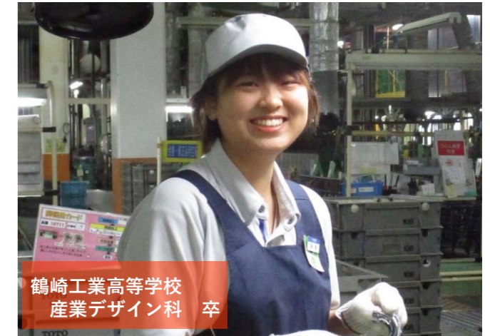
鶴崎工業高等学校 産業デザイン科 卒

切砥琢磨できる心強い同期や優しい先輩、全力でサポートしてくれる上司のおかげで、毎日笑顔で働いています。