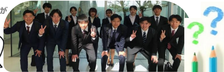
たくさんの同期と一緒に♡