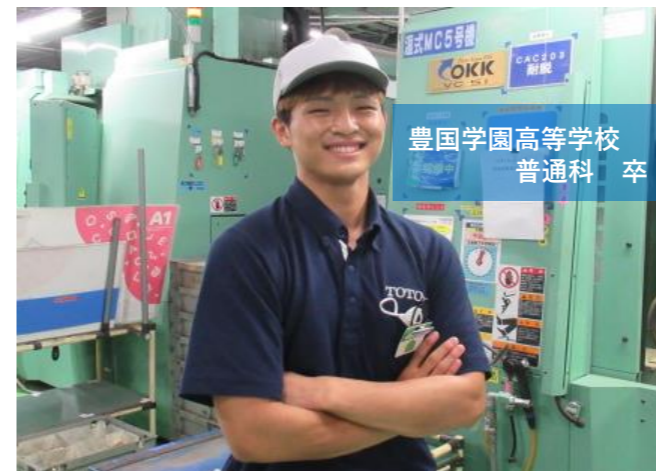
豊国学園高等学校 普通科 卒

①電気温水器の組み立て作業を担当しています。②何か壁にぶつかった際に協力したり考えたりすることで乗り越えられ、達成できた時です。③個人のスキルと現場改善能力を高めて、組長（現場管理責任者）になることを目指しています。④優しく頼りになる先輩方と一緒に仕事ができることです。⑤ポジティブな思考を持って色々なことに挑戦してみてください！