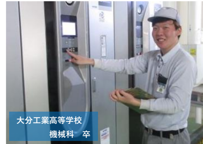
大分工業高等学校 機械科 卒

①水栓金具にメッキをつける鍍金工程で、部品の付け外し作業と外観検査を担当しています。②施設やお店にTOTO商品が設置されているのを見た時です。また、作業を完璧に習得したり、自分なりに工夫して改善したりすると先輩が褒めてくれるのでモチベーションが上がります！③外観検査のスキル向上、品質管理検定の取得、鍍金課で行える作業を全て習得し、オールマイティな人材になることです。④仲が良く切砥琢磨できる心強い同期や優しく面白い先輩方、全力でサポートしてくれる上司のおかげで、毎日楽しく笑顔で働いています。⑤社会に出る上で人間関係や業務への不安はあると思いますが、失敗を恐れることなく一生懸命頑張ってください！