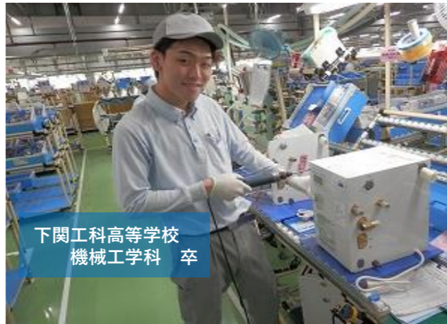
下関工科高等学校 機械工学科 卒

壁にぶつかった時に解決策を考えたり、周りとの協力したりして乗り越えられるとやりがいを感じます。