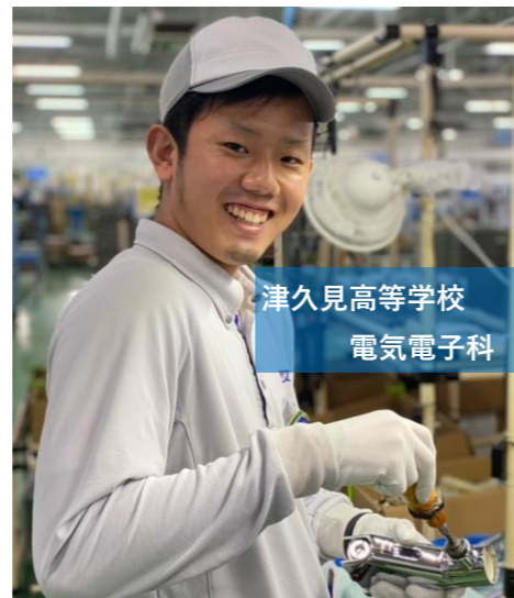
津久見高等学校 電気電子科 卒

色々な業務を経験でき、スキルアップができると同時にプライベートも充実できる素敵な会社です！