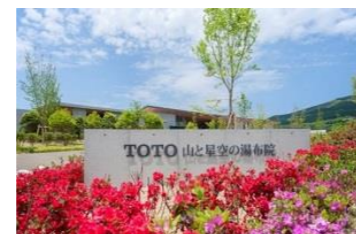
TOTO 山と星空の湯布院(保養所)