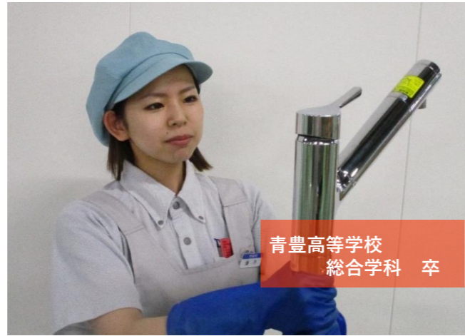
青豊高等学校 総合学科 卒

自身が成長できている喜びを味わえるとともに、社会に貢献している実感を得ることができます！