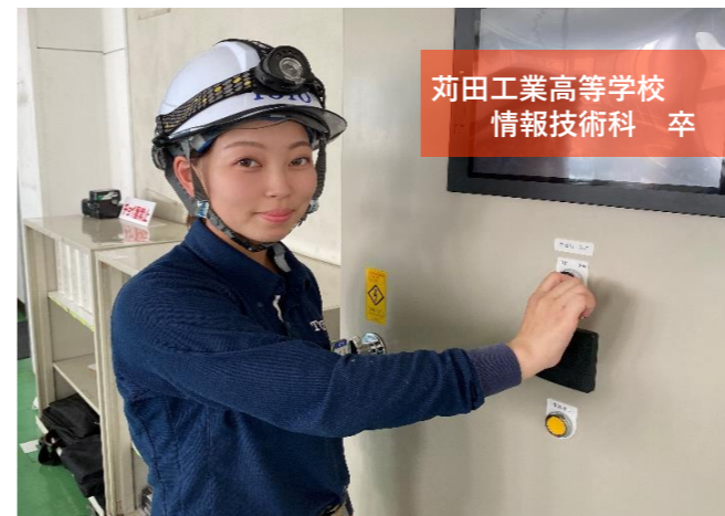
苅田工業高等学校 情報技術科 卒