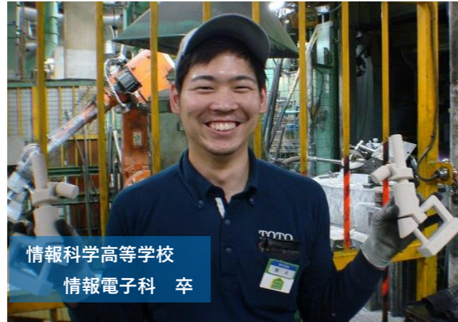
情報科学高等学校 情報電子科 卒

夏祭りやリモデルフェアなど、イベントに参加するので他部署の人との関わりが増えます！