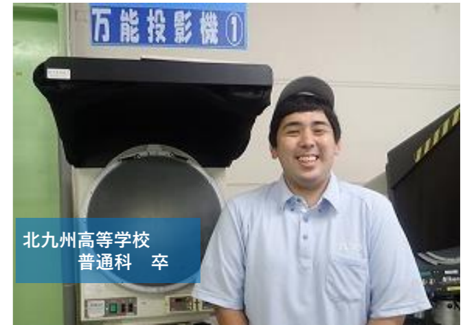
北九州高等学校 普通科 卒

①主に海外の部品メーカー様に対する是正業務を行っています。労働組合の職場委員としても、働きやすい職場の実現に尽力しています！②不具合が発生した際に海外メーカー様と連携して是正を行い、再発防止をすることで品質向上に繋がれた時です。③測定スキルがまだまだ未熟なため、積極的に測定機に触れることでスキルの向上を図りたいと思います。また、知識を更に身につけ、海外メーカー様と連携して品質向上に努めていきたいです。④優しい先輩方や同期と知り合うことができ、良い人間関係を築けたことです。⑤勉強ももちろん大事ですが、仕事を行う上ではコミュニケーション能力や「報連相」も大切だと思うので、意識して生活してみてください！