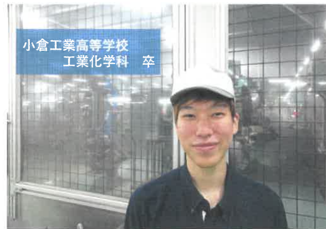
小倉工業高等学校 工業化学科 卒

① 水栓金具の研磨工程を担当しており、研磨ロボットのオペレーター及び固有技術が必要とする手研磨作業に携わっています。② 自分ひとりで手研磨作業を行い、合格品を造り出せた時など、今までできなかったことができるようになった時です。③ 業務に必要な知識や技術を向上させ、担当している研磨作業のスキルアップを図りたいと思っています。④ 先輩方が優しく接してくれる働きやすい職場であることです。⑤ 最初は分からないことばかりで苦労しましたが、自分自身成長できていると日々感じています。TOTOアクアテクノと一緒に働き、成長しましょう!