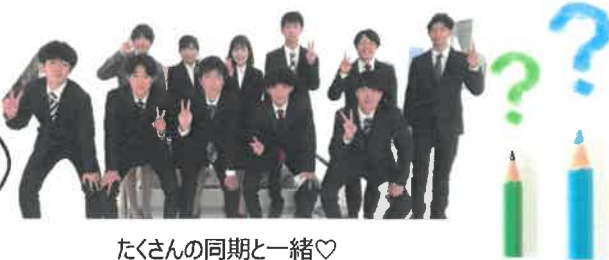
たくさんの同期と一緒に♡