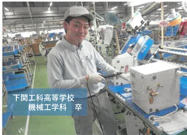
下関工科高等学校 機械工学科 卒

壁にぶつかった時に解決策を考えたり、周りと協力したりして乗り越えられるとやりがいを感じます。