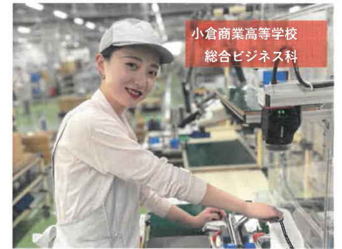
小倉商業高等学校 総合ビジネス科

① 製品の組み立て・検査・包装を担当しており、新商品の立ち上げや間接業務も行っています。② 報告会等で自分の仕事が評価された時です。また、自ら業務の中で問題点を見つけて対策ができた時には成長を感じます。③ 人のためになれるように、製品や間接業務の知識を身につけ、周りを見て行動できる上司を目指しています。④ 周りの人に恵まれていることです。困りごとがあればたくさんの方が助けてくれます。⑤ 失敗を恐れず、何事にも意欲的に取り組んでみてください。必ずいい結果が待っています!