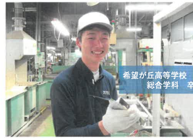
希望が丘高等学校 総合学科 卒

①電気温水器の組み立て作業を担当しています。②何か壁にぶつかった際に協力したり考えたりすることで乗り越えられ、達成できた時です。③個人のスキルと現場改善能力を高めて、組長（現場管理責任者）になることを目指しています。④優しく頼りになる先輩方と一緒に仕事ができることです。⑤ポジティブな思考を持って色々なことに挑戦してみてください！