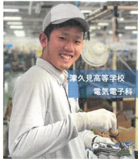
津久見高等学校 電気電子科 卒

色々な業務を経験でき、スキルアップができると同時にプライベートも充実できる素敵な会社です！