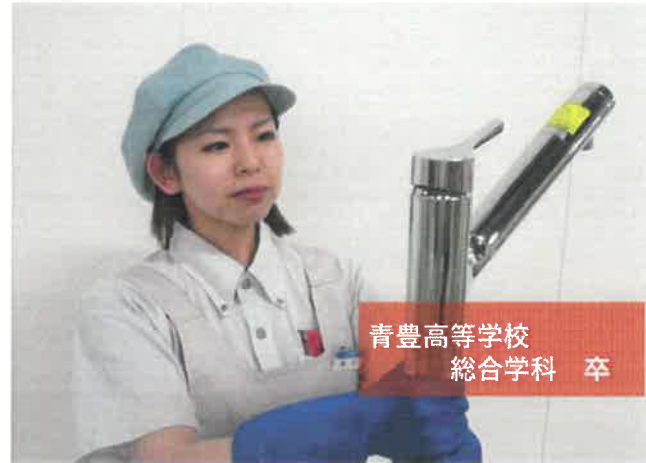
青豊高等学校 総合学科 卒

自身が成長できている喜びを味わえるとともに、社会に貢献している実感を得ることができます！