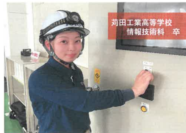
苅田工業高等学校 情報技術科 卒