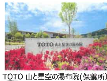
TOTO 山と星空の湯布院(保養所)