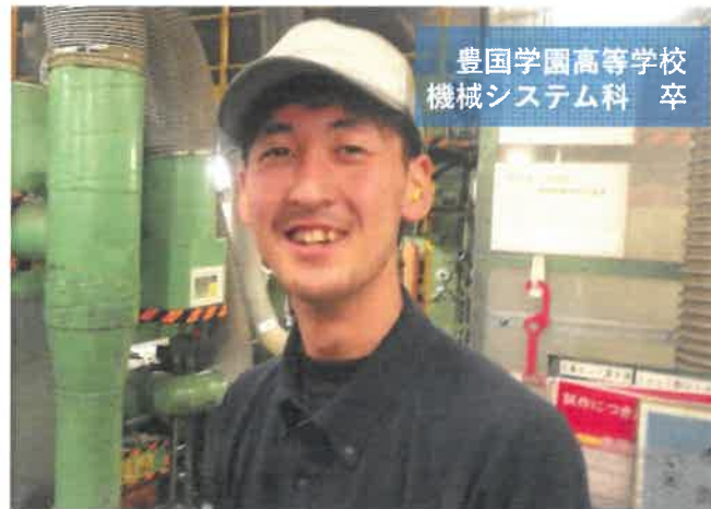
豊国学園高等学校 機械システム科 卒