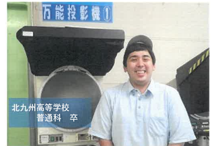
北九州高等学校 普通科 卒

①主に海外の部品メーカー様に対する是正業務を行っています。労働組合の職場委員としても、働きやすい職場の実現に尽力しています！②不具合が発生した際に海外メーカー様と連携して是正を行い、再発防止をすることで品質向上に繋がれた時です。③測定スキルがまだまだ未熟なため、積極的に測定機に触れることでスキルの向上を図りたいと思います。また、知識を更に身につけ、海外メーカー様と連携して品質向上に努めていきたいです。④優しい先輩方や同期と知り合うことができ、良い人間関係を築けたことです。⑤勉強ももちろん大事ですが、仕事を行う上ではコミュニケーション能力や「報連相」も大切だと思うので、意識して生活してみてください！