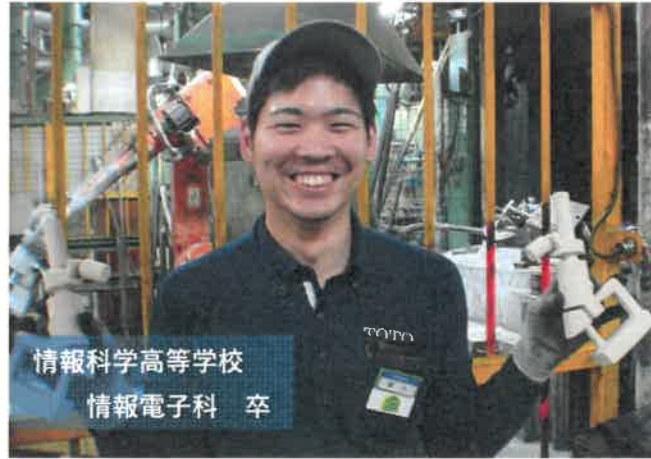
情報科学高等学校 情報電子科 卒

夏祭りやリモデルフェアなど、イベントに参加するので他部署の人との関わりが増えます！