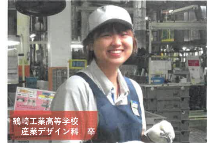
鶴崎工業高等学校 産業デザイン科 卒

切琢磨できる心強い同期や優しい先輩、全力でサポートしてくれる上司のおかげで、毎日笑顔で働いています。