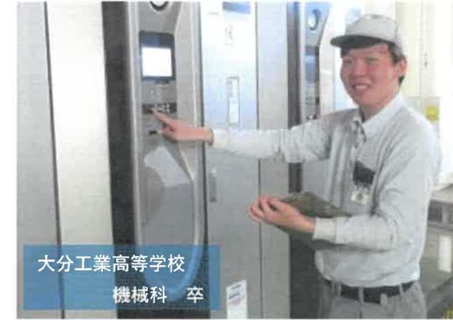
大分工業高等学校 機械科 卒

①インフラ設備の保全管理を行っています。②故障した設備等を直すことができた時です。③資格を取得することで自身のスキルアップをして、規模の大きい案件を一人でやり遂げることです。④職場の雰囲気が良いので、悩みや困りごとがあっても誰にでも気軽に相談できることです。⑤社会人になってからはメモを取ることが必須になるので、学生のうちからメモを取る癖をつけることが大切です！