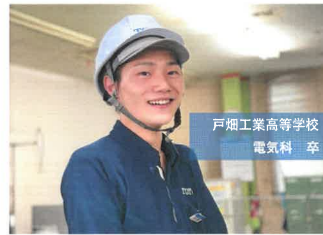
戸畑工業高等学校 電気科 卒

① 鋳造工程で、製品の通水部にあたる中子造型を担当しています。② 作業スピードが上がったと実感した時や、自分が生産した製品の品質があがった時です。③ 現在の担当業務をマスターして、次の工程に向けてスキルアップすることです。④ 現場の雰囲気が明るいため、年齢を気にせず会話ができ、すぐに職場に馴染めたことです。⑤ 何事も恐れず、全力で立ち向かってください!